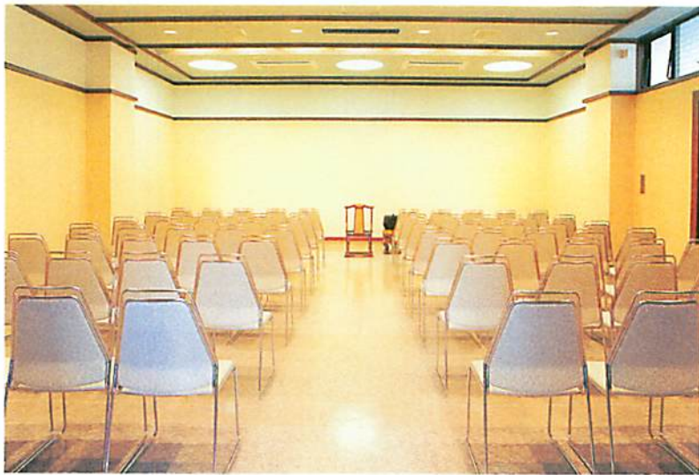
新井白石記念ホール