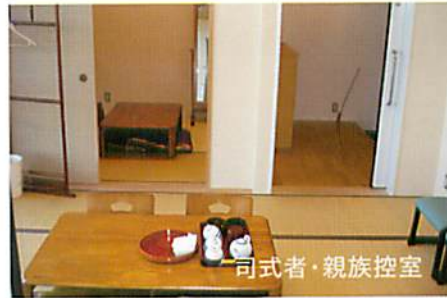
司式者・親族控室