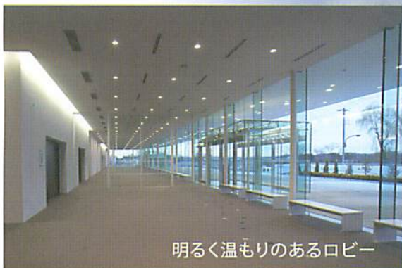
明るく温もりのあるロビー