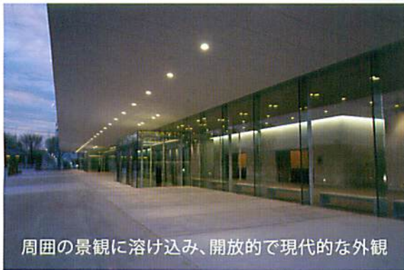
周囲の景観に溶け込み、開放的で現代的な外観