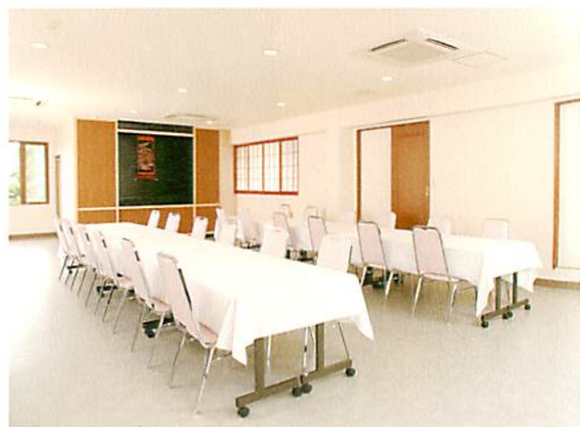
▲精進落とし(お清め所)・2階(60席)

一般葬から社葬まで、 宗旨・宗派を問はず ご利用いただけます。 一階は斎場、二階は皆様の お食事(お清め所)の場として ご利用いただけます。