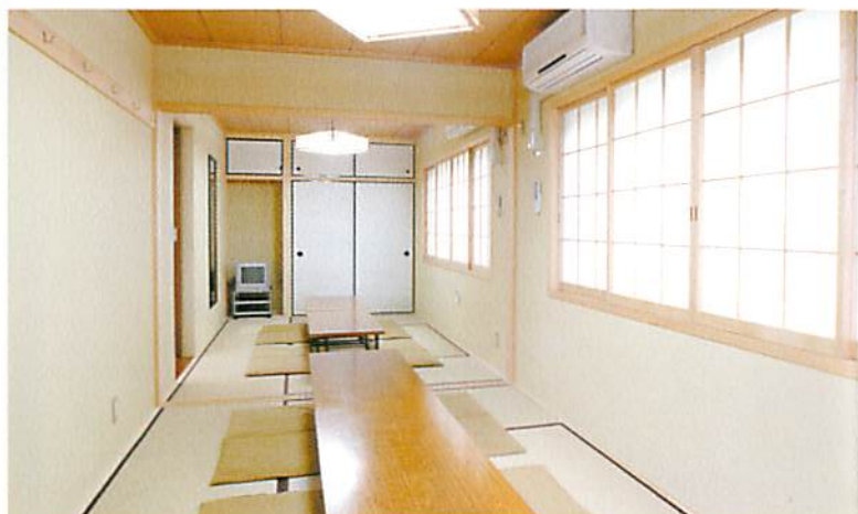
▲ご遺族控室(宿泊室)6畳・2部屋