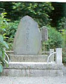
▲新選組 井上源三郎の碑