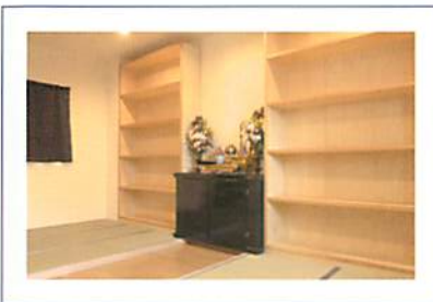
▲(上)納骨堂・(下)遺体安置室