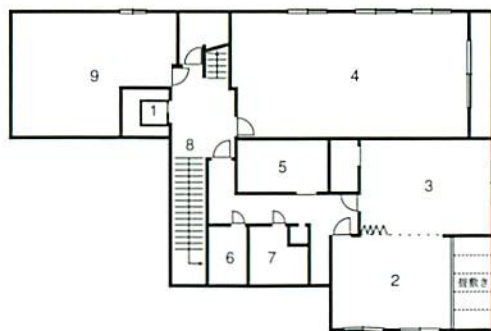
■2F/1:エレベーター 2:控室A 3:控室B 4:第二本堂 5:湯沸室 6:男トイレ 7:女トイレ 8:1Fへの階段 9:和室