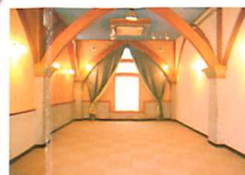
葬儀式場C 約20名で使用可能