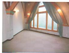
葬儀式場A 約10名で使用可能