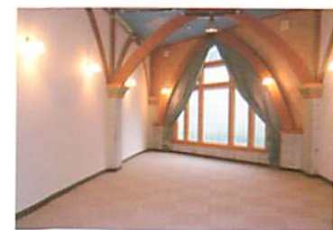
葬儀式場B 約15名で使用可能