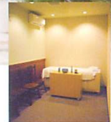
個別安置室 約10名まで使用可能