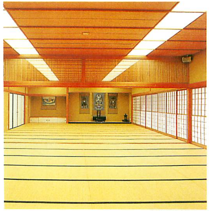
和室控室(八葉)(蓮華)