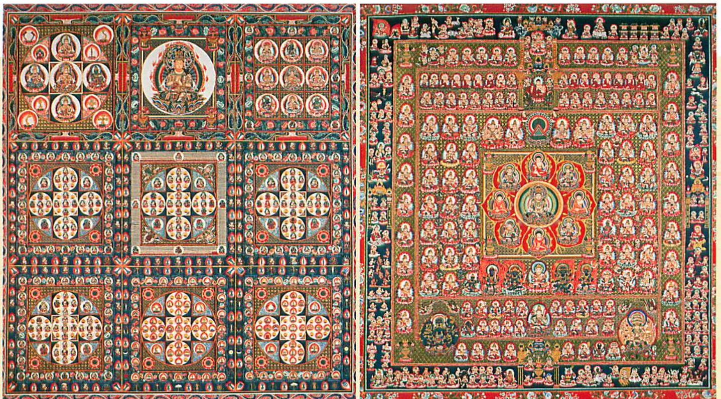
弘法大師様 現図両部曼荼羅 (真鍮鍍照兩筆)