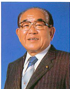
平塚市長 石川京一