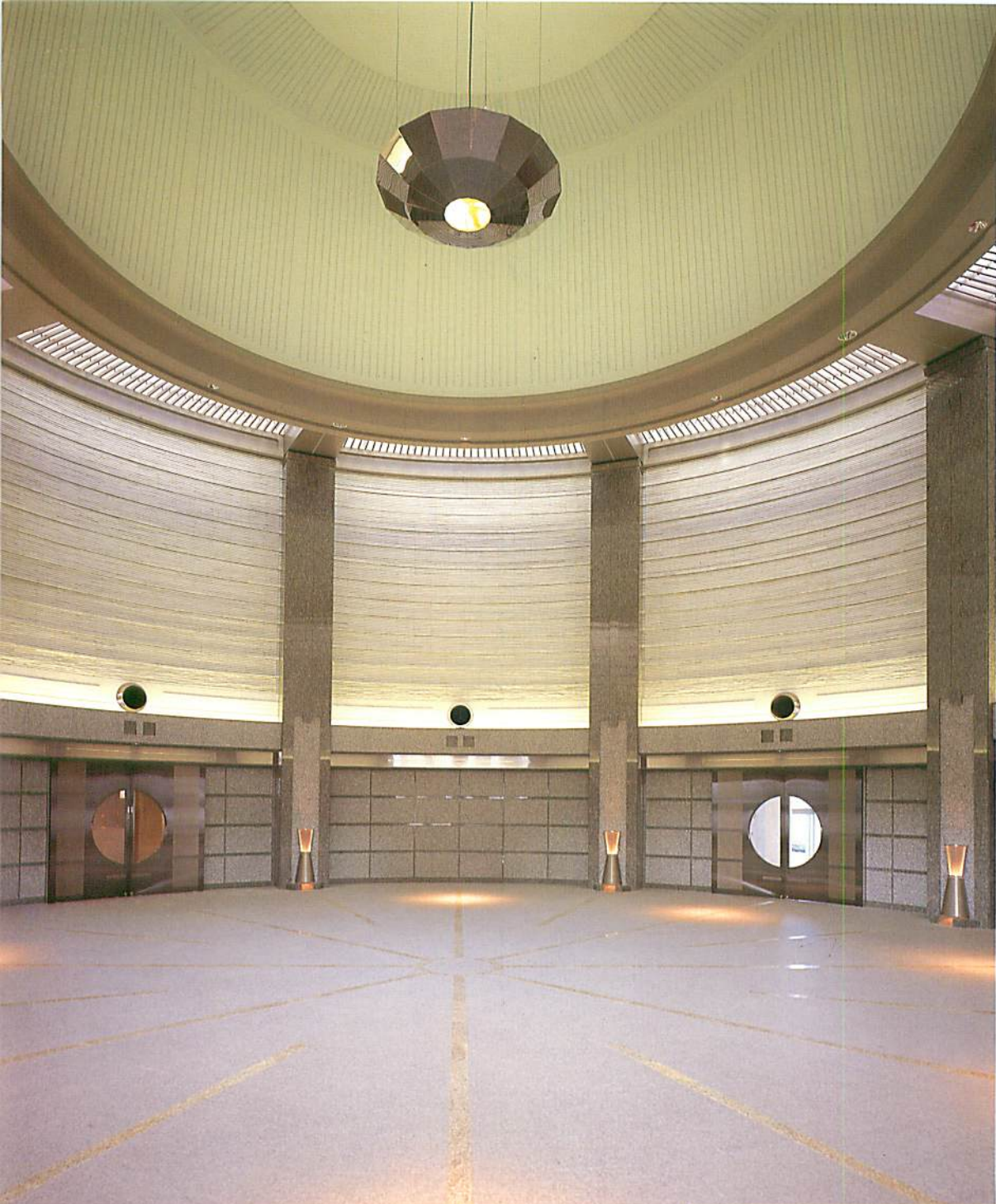
エントランス ホール