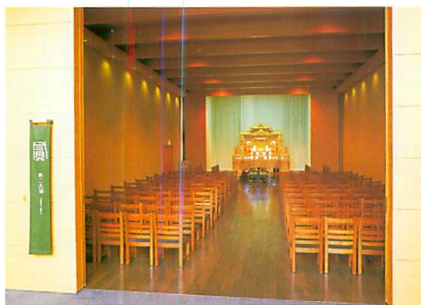
◁ロビーから見た 第2式場

市民聖苑に搬入された料理は、食品安全上お持ち帰りになることはできません。又、夜食等、時間をおいて飲食をしないでください。